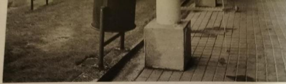
Interior de uno de los espacios de nichos del cementerio municipal, el cual pretende ampliarse en terreno.

De hecho, hace unos meses se hizo pública la relación de bienes. Entre éstos se recoge un inmueble con una superficie total de 51.360